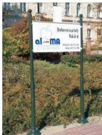
Település üdvözlő tábla