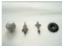
Csúcsdíszek CS-300 és R01-3200 oszlophoz