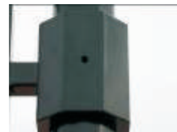
Adapter - egy síkban 8 tábla helyezhető el Az adapterek sorolhatók