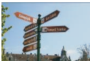
Keret nélküli tábla