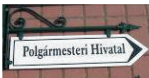
Keretes tábla dísszel