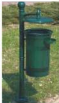
R típ.hulladékgyűjtő E02 típ. edénytesttel, R01-910/M oszloppal, tetővel