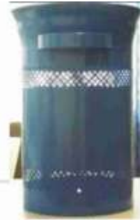
E02 típ. edénytest