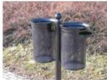
R típ. hulladékgyűjtő E01 típ.dupla edénytesttel, R01-CS oszloppal