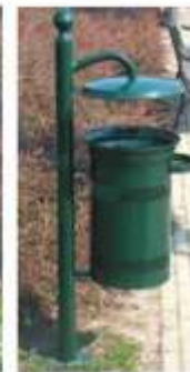
R típ.hulladékgyűjtő E02 típ. edénytesttel, R01-CS/M oszloppal, tetővel