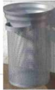
E01 típ. edénytest