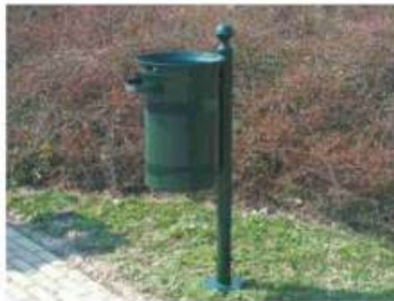
R típ. hulladékgyűjtő E02 típ.hedénytesttel R01-CS oszloppal