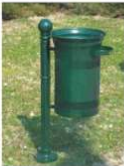
R típ.hulladékgyűjtő E02 típ.gedénytesttel, R01-910 oszloppal